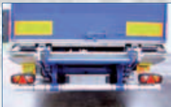
REP/4: 2 cilindri di sollevamento + 2 cilindri di rotazione e inclinazione automatica