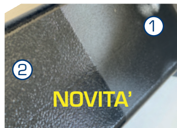
VERNICIATURA A POLVERE (2) SU BASE IN CATAFORESI (1). LA MIGLIORE PROTEZIONE CONTRO LA RUGGINE.