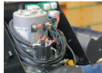
UNITÉ DE PUISSANCE À FAIBLE BRUIT & PAS D'ÉLECTRONIQUE = ENTRETIEN FACILE