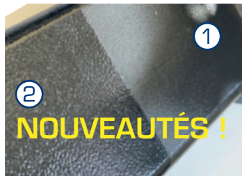
PEINTURE EN POUDRE (2) AJOUTÉE AU KTL PLUS (1). PAS DE ROUILLE ET PAS DE TACHES DE SEL.