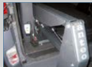
A • Kabelfernbedienung • Batterie Hauptschalter mit Schlüsselbetätigung