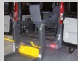
8 Automatisches überfahrblech