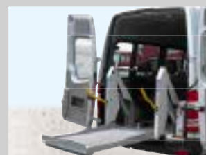
B • Handpumpe zur Notbetätigung • Abrollschutz für Rollstuhl