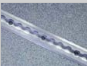
9 AIRLINESCHIENE 3.65 m.