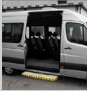
ST 1100 ELEKTRISCHE AUSFAHRBARE EINSTIEGSHILFE