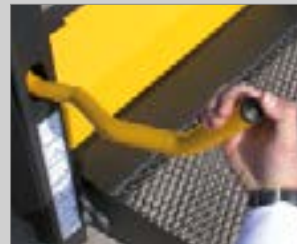
3 Wippschalter zum heben und senken