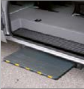
ST 600 ELEKTRISCH AUSFAHRBARE EINSTIEGSHILFE