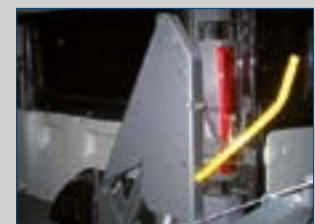
C Automatische Haltgriffe