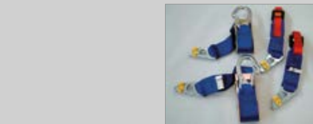
5 4 Punkt Sicherheitsgurt zur befestigung an Zurringen