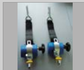
7 Sicherheitsgurt für Rollstühle bei eingebauten Airlineschienen