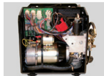
UNITÉ DE PUISSANCE À FAIBLE BRUIT & PAS D'ÉLECTRONIQUE = MAINTENANCE FACILE