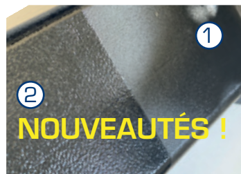
PEINTURE EN POUDRE (2) AJOUTÉE AU KTL PLUS (1). PAS DE ROUILLE ET PAS DE TACHES DE SEL.